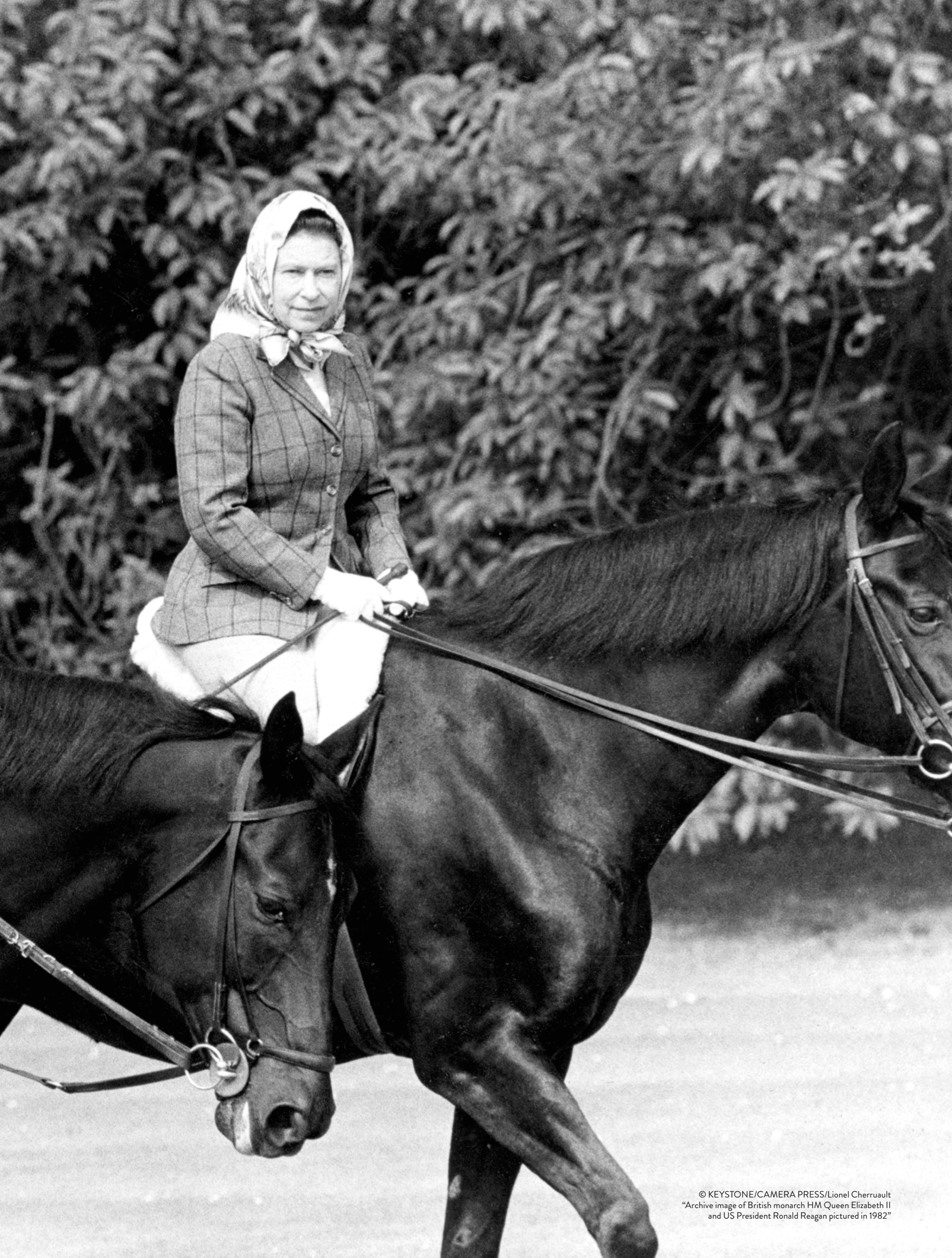
"Archive image of British monarch HM Queen Elizabeth II and US President Ronald Reagan pictured in 1982"